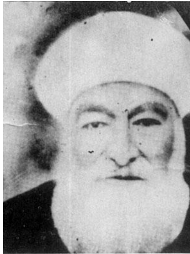
عالم متقی مجاهد مشهور شیخ محمد تقی بافقی

در شب اول فروردین سال ۱۳۰۶ ش، به هنگام تحویل سال، همسر بی شرم رضاخان به همراه عده‌ای از زنان درباری با وضعی زننده و دور از عفت، به آستانه حضرت معصومه (س) در قم رفته و در ایوان آینه جای گرفتند. چون زنان درباری بدون حجاب، وارد حرم شده بودند، یکی از وعاظ به طرز حجاب آنان اعتراض کرد. در این حال، عالم پرهیزگار و شجاع. شیخ محمد تقی بافقی بر آنان شورید و مردم را نیز علیه آنان وادار به اعتراض نمود. وقتی که این خبر را به رضاخان گزارش نمودند، وی در روز دوم فروردین با حالتی غضبناک به اتفاق عده‌ای از مسؤولان نظامی وارد قم شد و یکسره به سمت حرم رفته، دستور ضرب و شتم روحانیان و آیت‌الله بافقی را صادر کرد. رضاخان سپس دستور داد که آیت‌الله بافقی را به شهر ری تبعید نمایند. سرانجام چند سال بعد این عالم مجاهد، پس از اخراج رضاخان از ایران به قم بازگشت. برخی از محققان، واکنش تند آیت‌الله بافقی را نسبت به حضور زنان بی حجاب در حرم حضرت معصومه (س) سبب نزدیک به هشت سال تأخیر در اعلام رسمی کشف حجاب می‌دانند. همچنین، شجاعت آیت‌الله بافقی در رویارویی با رضاخان، تأثیر شایانی در حوزه علمیه قم بر جای نهاد به طوری که امام خمینی (ره) در درس اخلاقی که در دهه ۱۳۲۰-۱۳۱۰ در قم می‌دادند، آیت‌الله بافقی را نمونه‌ای ذکر می‌کردند که باید سرمشق قرار گیرد.